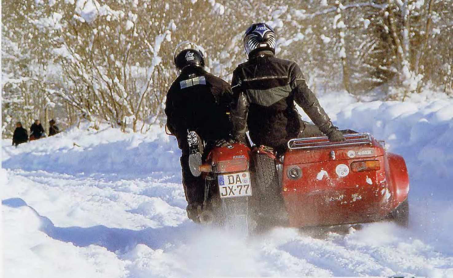
Spaß pur: Mit dem Gespann über eine tief verschneite Piste brettern.

D ie Götter sind uns wohl gesonnen. Strahlend blauer Himmel und eine weiße Landschaft bezaubern uns nach jeder Kurve von Neuem. Ein Tross von elf Gespannen zieht wie an der Perlenschnur gezogen durch die Berge Österreichs. Die 20 Prozent Steigung auf der Straße von Trieben nach Hohentauern sind vielleicht für die Motoren eine Herausforderung, nicht aber für die Fahrer. Sie sind bereit, den Olymp der Winterfahrer zu erklimmen. In den Kofferräumen rasseln Schneeketten und andere Hilfsmittel. Um eine 14prozentige Steigung auf einer Schneepiste sicher zu bezwingen, muss man gut vorbereitet sein.