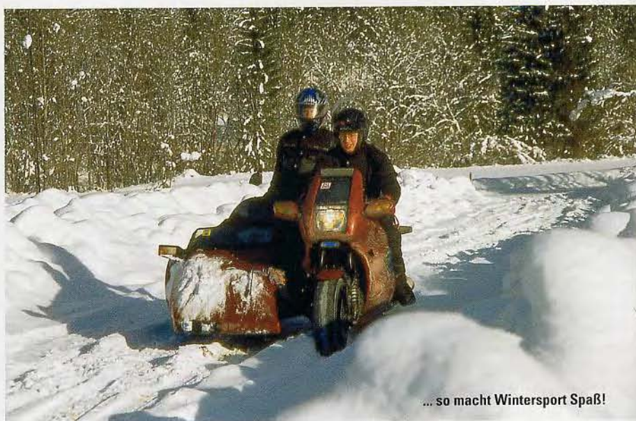
... so macht Wintersport Spaß!

Blauer Himmel und Sonnenschein lassen am nächsten Tag etwa 30 Gespanne zu einer gemeinsamen Ausfahrt starten. Die Strecke über die so genannte Kaiserau hat es in sich. Ein Ural-Gespann küsst auf der steilen Abfahrt zärtlich ein entgegenkommendes Auto. Beide Fahrer kommen mit dem Schrecken davon.