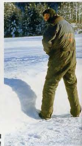
... und einmal leermachen!

der werktätigen Gesellschaft an und befestigen die Steigeisen für unsere Gespanne. Der Cross-Reifen meines BMW-Gespannes wird mit sechs Trabbi-Ketten umwickelt. Kunststoffriemen sorgen für den nötigen Halt und das Stollenprofil sichert die Ketten gegen Verdrehen. Diese Methode hat sich bei schmalen Reifen bestens bewährt. Die erste Hürde ist die Mautstelle, wir müssen anhalten und den Obulus von zwei Euro entrichten. Aber das BMW-Gespann tuckert wieder mühelos an der eisigen Schräge vorwärts. Noch knallen die Ketten beim Einfedern gegen den Plastikkotflügel.