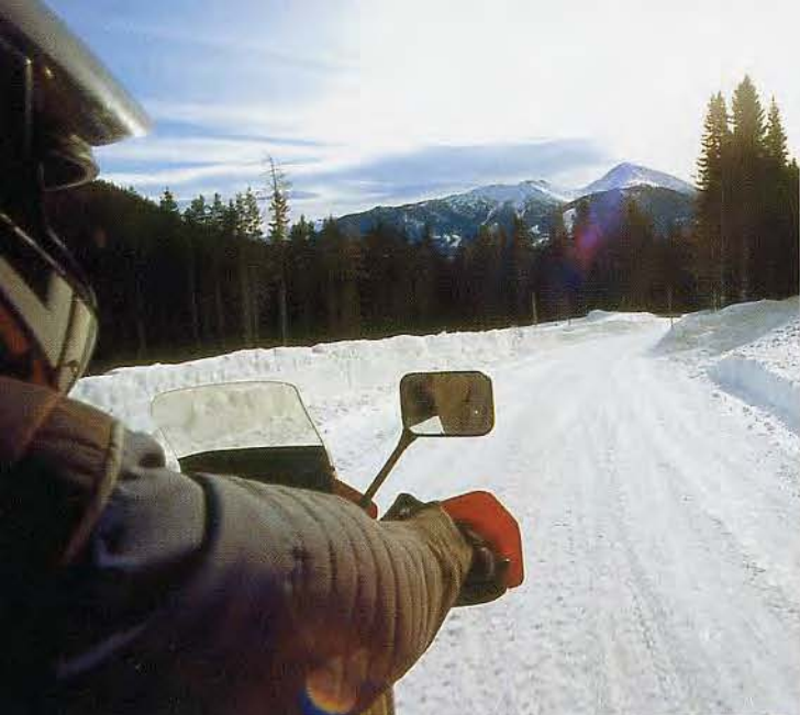
Sonne pur...Schnee pur... Motorradfahren pur!